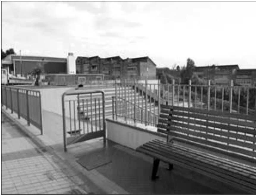
L'area attrezzata "Mario De Falco" di rione Capodimonte; a destra un momento dell'inaugurazione

L'uso pubblico dell'area attrezzata "Mario De Falco" rientrerà, comunque, in un regolamento