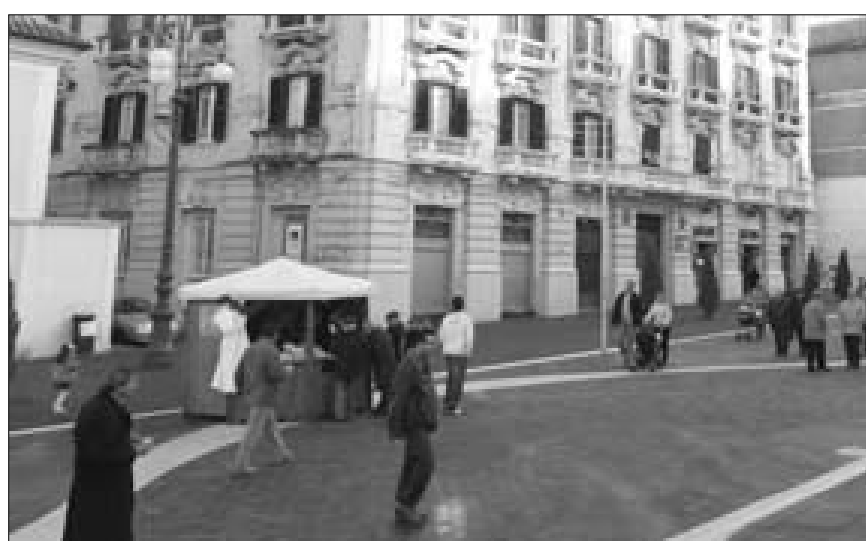
Due momenti della rassegna dedicata all'antica tradizione dolciaria di Benevento svoltasi lungo il corso Garibaldi