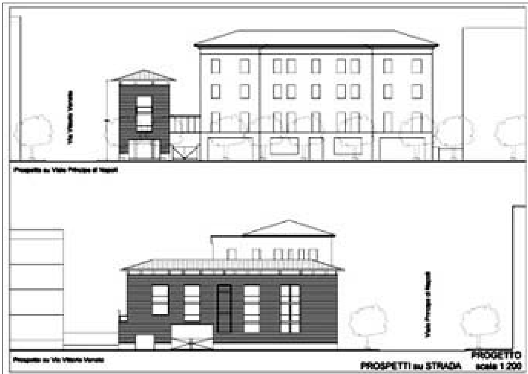
I grafici della nuova sistemazione dell'immobile di viale Principe di Napoli

Parallelamente l'assise cittadina vota anche la necessaria variazione di Bilancio per poter favorire l'insediamento a viale Principe di Napoli, visto che la ristrutturazione dell'edificio, inserita nel Piano triennale delle opere pubbliche del Comune di Benevento, prevedeva un intervento economico