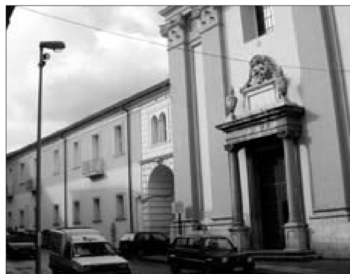
La casa - albergo di via San Pasquale

Di qui la decisione di affidare ai privati, mediante un bando pubblico, la gestione della casa di riposo, prevedendo anche un introito per il Comune (1500 euro