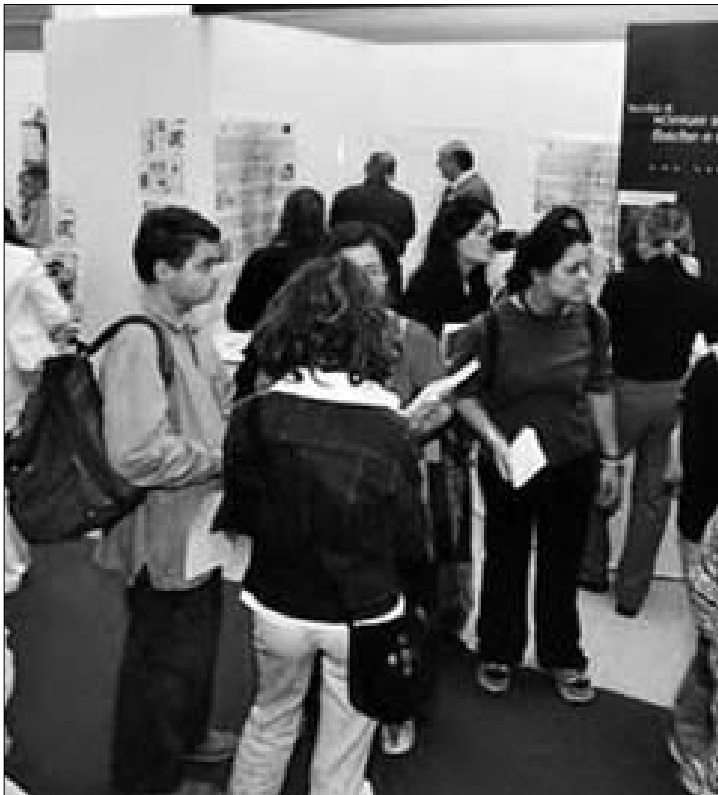
Il mondo giovanile è sempre più attento alle politiche occupazionali

I sottoscrittori dell'intesa concordano sulla importanza della catalogazione informatica del patrimonio; attività che sarà completata anche con l'impiego della tecnologia RFID. Nell'ambito delle attività verranno realizzati una pubblicazione e un cd, al fine di favorire e promuovere la conoscenza del territorio di Benevento e della sua storia.