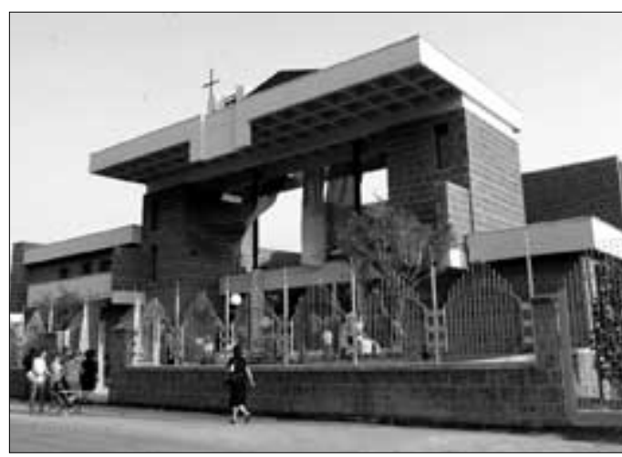
La chiesa di Santa Maria degli Angeli

Oltre alle unità abitative, l'intera area sarà interessata da interventi di recupero ambientale