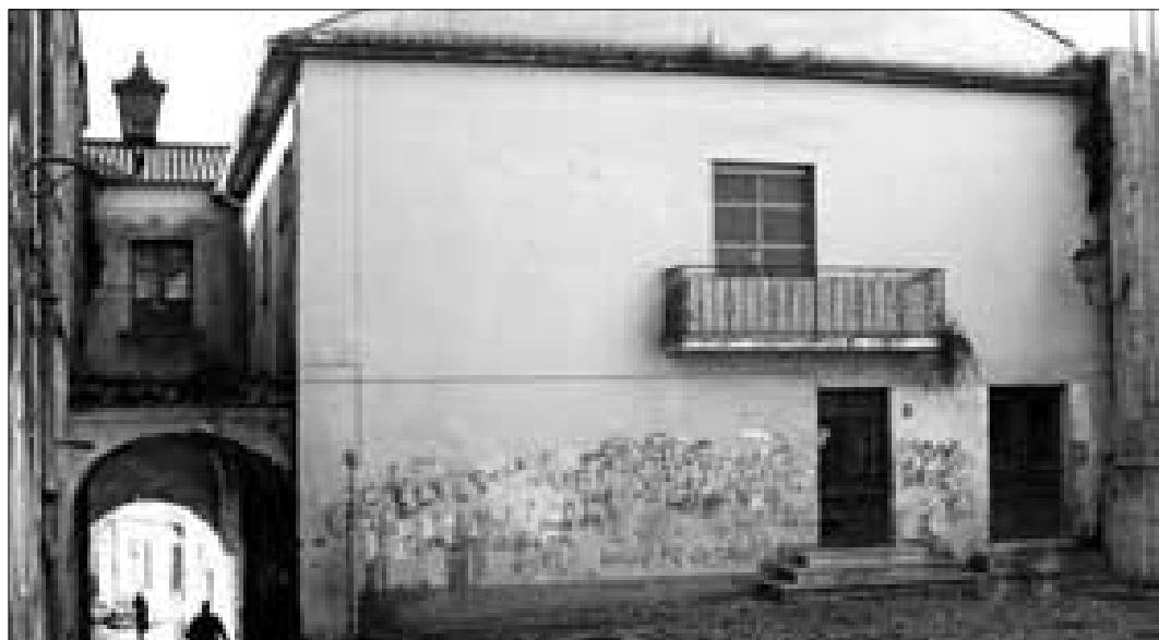
Il lato "B" del complesso San Vittorino, che sarà oggetto di recupero da parte del Comune

La parte predominante dell'intervento riguarda il consolidamento delle murature e delle volte, il ripristino dei solai, un più generale miglioramento struttura-