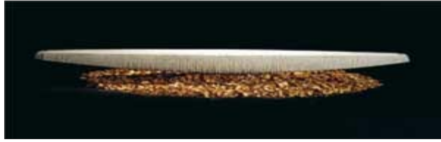
In alto Yves Dana Offrande, 2004 © Yves Dana

ORARI martedì e giovedì dalle 17 alle 21 mercoledì, venerdì, sabato e domenica dalle 11 alle 13 e dalle 17 alle 21 chiuso il lunedì