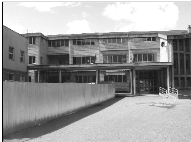
La scuola di via Grimoaldo Re, dove saranno installati i pannelli solari fotovoltaici