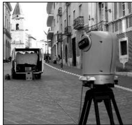
Rilievi lungo corso Garibaldi

Sempre in tema di salvaguardia del centro storico, va ricordato che sono una sessantina le pratiche avviate in esecuzione del bando di concorso finalizzato alla concessione di contributi a fondo perduto per il recupero delle "parti comuni" (facciate, scale, strutture interne ed esterne) degli edifici privati danneggiati da calamità naturali.