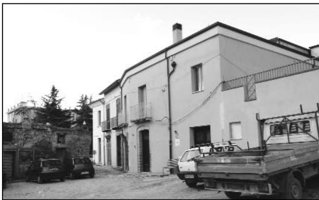
Fabbricati vecchi e nuovi nell'area Bagni