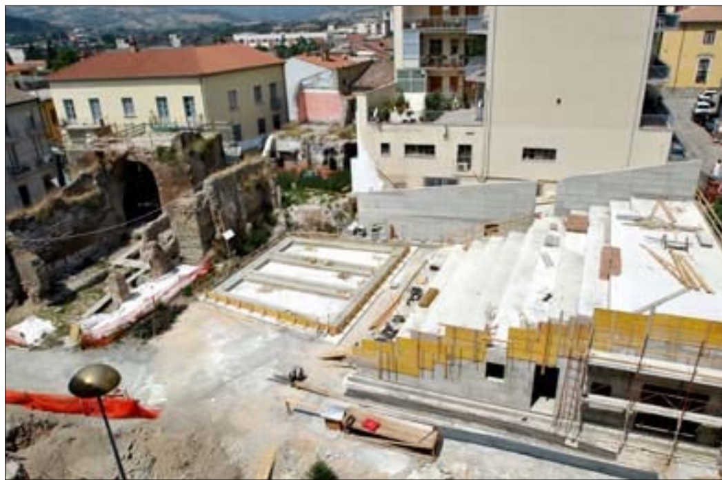
Lavori in corso nell'area dell'Arco del Sacramento

Il teatro all'aperto è, in ogni caso, l'esemplificazione più significativa dell'intervento voluto dal Comune e inserito nel progetto integrato Benevento: il futuro