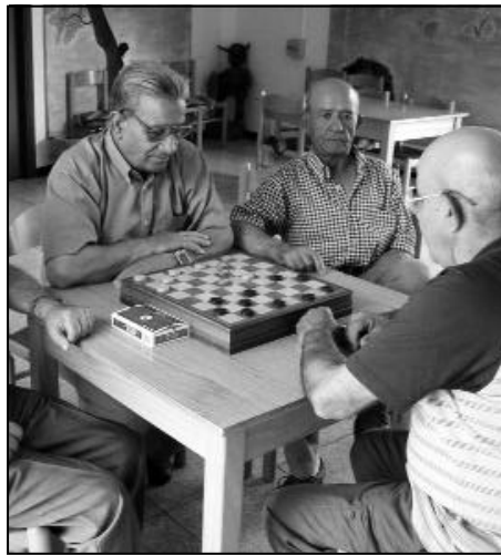
Anziani impegnati in attività ricreative

Il servizio "Pronto anziani" è disponibile al numero telefonico verde 800 192 787