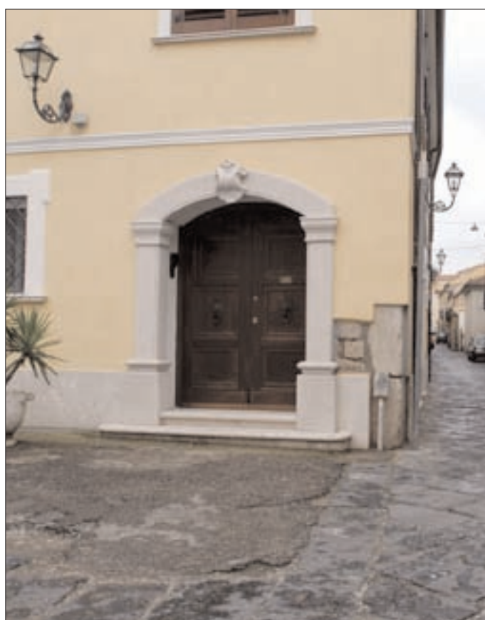
Uno scorcio del Triggio. A destra una rassegna in costume. In basso il classico torrone di Benevento

La notte della domenica è poi previsto il festival Medioevo con una parata in costume lungo il quartiere Triggio e fino all'interno del teatro romano. Durante l'intera manifestazione gli esercizi pubblici resteranno aperti tutta la notte.